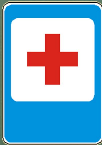
Пункт первой медицинской помощи