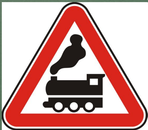
Железнодорожный переезд без шлагбаума