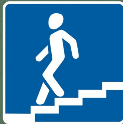
Подземный пешеходный переход