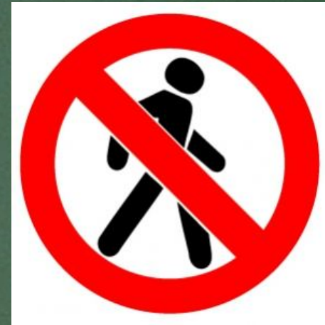
Движение пешеходов запрещено