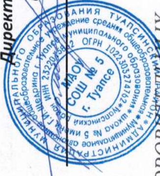
ГРАФИК ПРОВЕДЕНИЯ СПОРТИВНО-МАССОВЫХ И ФИЗКУЛЬТУРНО-ОЗДОРОВИТЕЛЬНЫХ МЕРОПРИЯТИЙ СРЕДИ УЧАЩИХСЯ МАОУ СОШ №5 ИМ.Г.И.ЩЕДРИНА МО ТУАПСИНСКИЙ РАЙОН НА 2023-2024 УЧЕБНЫЙ ГОД