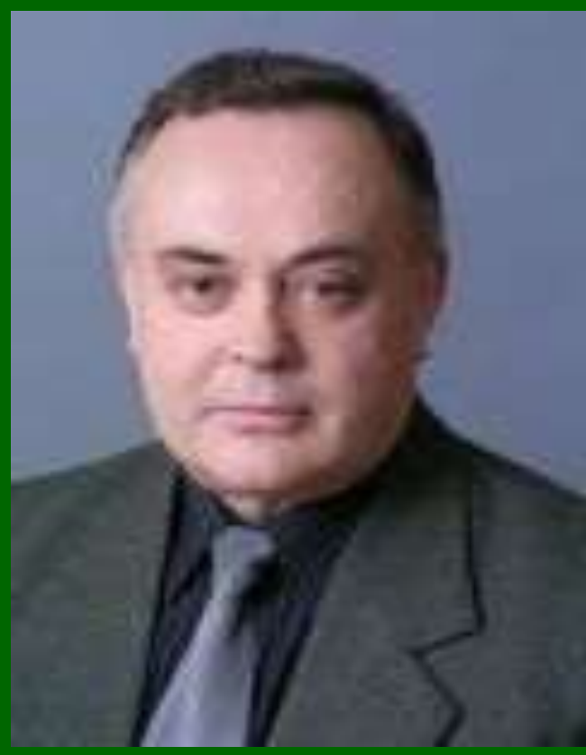
А. Н. Костенко

В настоящее время актуализируется проблема преодоления разрыва между так называемыми «естественными науками» и «социальными (гуманитарными) науками», который трактуется как нарушение принципа природной целостности мира. Украинский ученый А.Н.Костенко сформулировал принцип социального натурализма. Социум, исходя из этого принципа, - это тоже природа, но природа отличная от физической и биологической природы - так называемая «третья природа», существующая по своим природным законам (так называемая "теория трех природ"). На основании принципа социального натурализма все науки, в том числе и социальные (гуманитарные) науки признаются равным образом естественными науками.