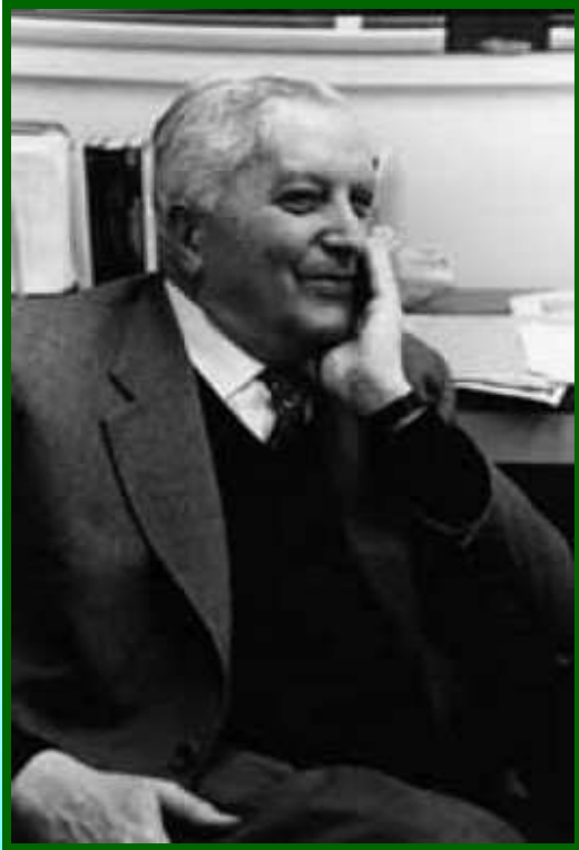
И. Р. Пригожин

Во второй половине 20 века обозначилась тенденция к сближению друг с другом не только разных общественных наук, но и их всех с естественными и точными науками. Эта тенденция отразилась, прежде всего, в формировании и росте популярности основанной И.Пригожиным синергетики – науки о наиболее общих закономерностях развития и самоорганизации сложных систем (включая и общество). Тем самым на новом витке развития науки происходит как бы возвращение к представлениям древних о едином «космосе».