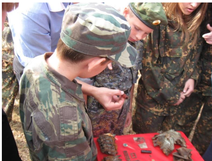
Предметы, найденные в месте захоронения, переданы в Курганинский исторический музей