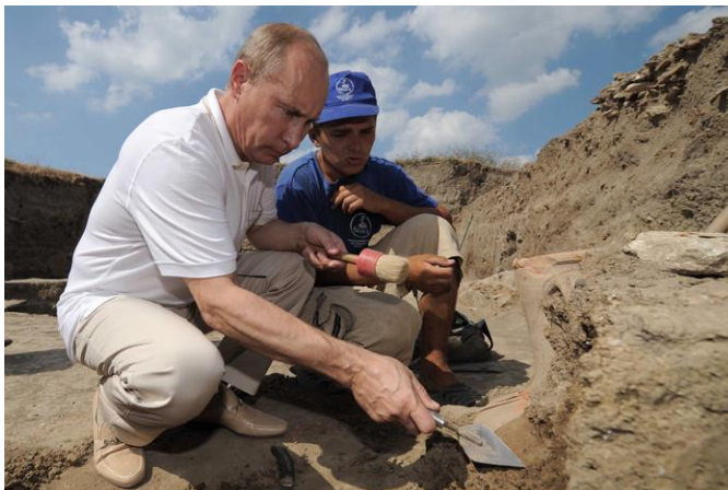
В.Путин на раскопках

В Курганинском историческом музее введены уроки по профориентации. Не только восславить профессии связанные с нашим регионом, но и популяризировать работу музейного сотрудника.