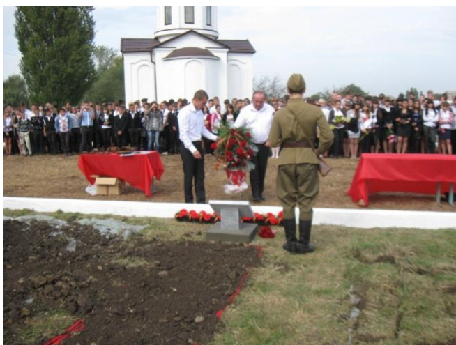
Возложение цветов к новому памяtnому монументу