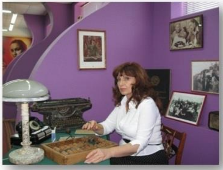
Гость из Краснодара

Вы можете побродить самостоятельно по экспозициям , при желании Вам расскажут об истории наши сотрудники.