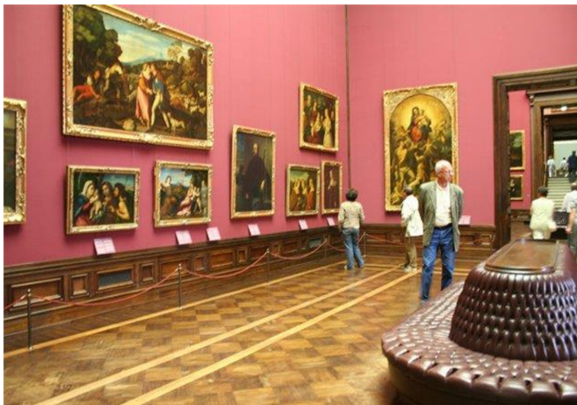
Прекрасный мир живописи. Его тоже надо суметь помочь открыть.

В залы музея заходят молодожены, гости нашего района. Всем хочется оставить для себя память о посещении в Курганинский исторический музей.