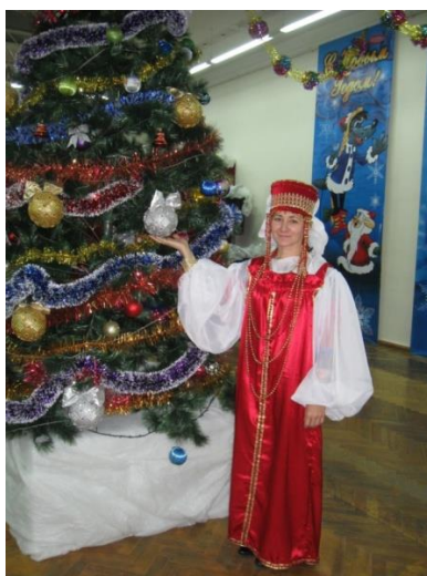
Сотрудники входят в образ