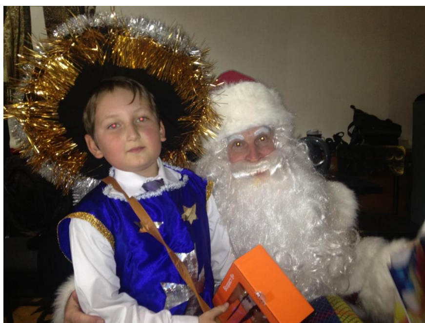
У нас лучший Дед Мороз