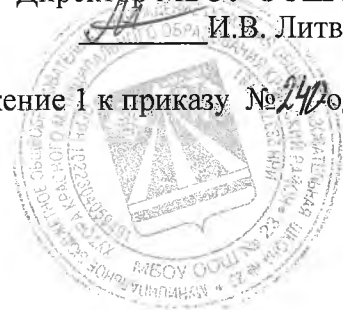
График питания учащихся МБОУ ООШ № 23

Приложение 1 к приказу №240 од от 31.08.22