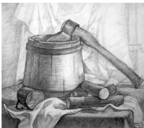
3, 4 и 5 примеры

Натюрморт из четырех предметов и двумя драпировками. Натурный стол - пол, тема «Баня». Тела вращения: цилиндр (ковш и бадья), конус (ведро). Куб – табуретка.