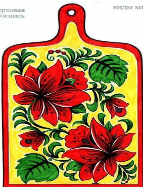
виды хохломской росписи: