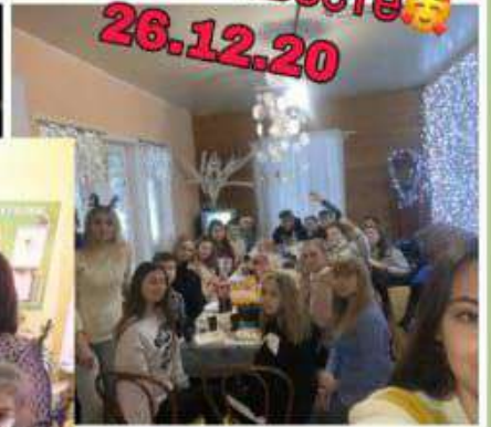
8 "Б" на квесте 🤩 26.12.20