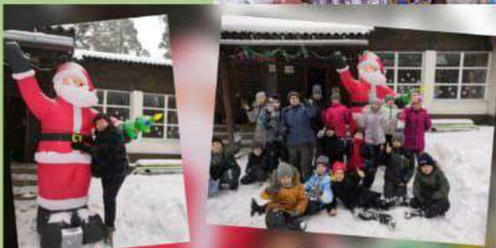
Квест, 4б класс