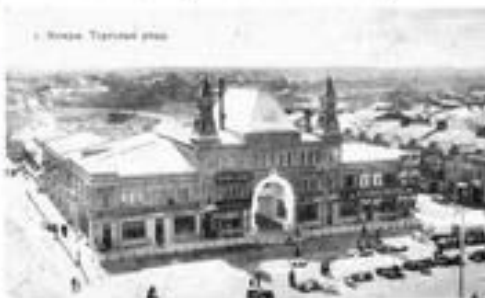
Кимры. Старый вид

Раскопки, проводимые в 1936 году, показали, что в X—XI веках на берегу Волги располагались поселения финноугров. В 1950-е годы в районе деревни Плещиново, напротив устья Уотчи, проводились археологические исследования, в частности, были изучены два круглых кладбища финноугров. В могилах были обнаружены не только славянские предметы обихода, но и фино-балтийские. По предположениям исследователей, финно-