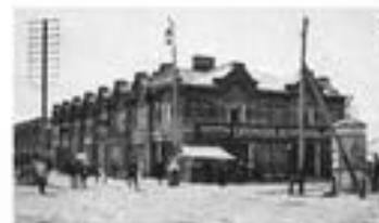
Кимры летом 1549 года