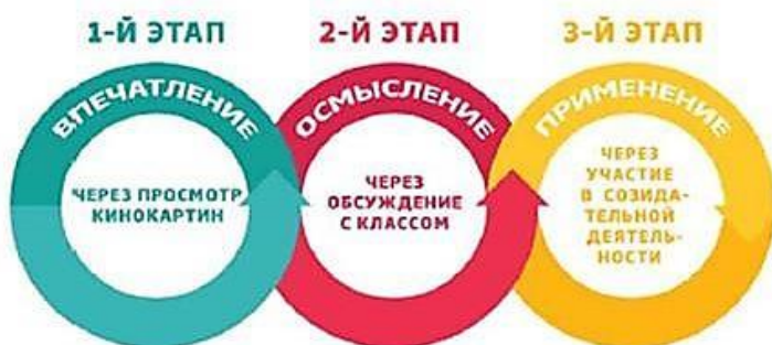
Рис. 1. Этапы проведения киноуроков

3) важным результатом киноурока – возникшая у школьников потребность подражания героям, которая реализуется в ходе проведения социальной практики , – общественно полезного дела, инициированного детьми и позволяющего проявить рассматриваемое качество личности на практике.