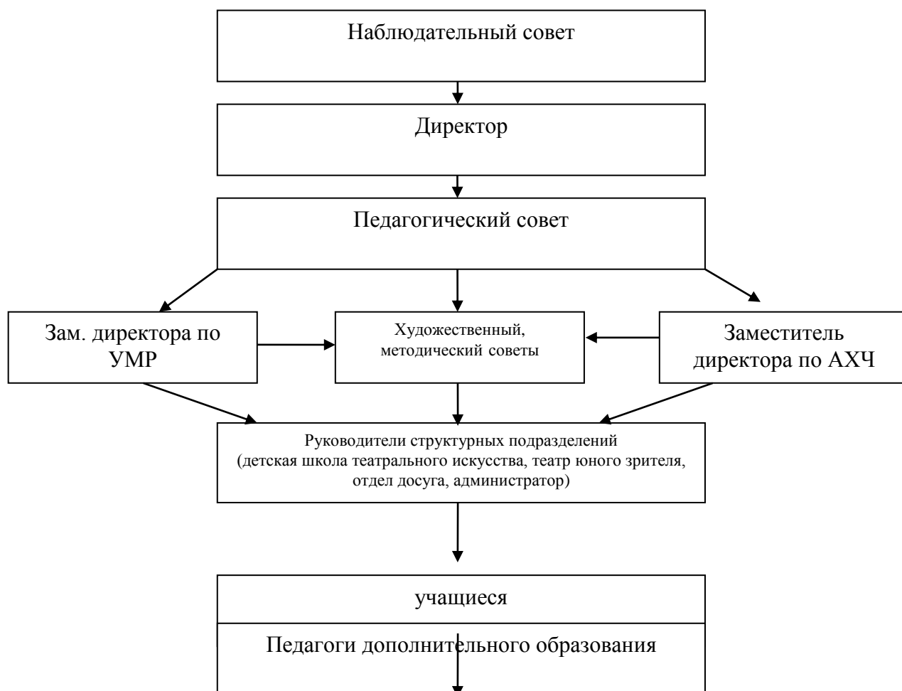
Схема системы управления МАУ ДО ЦЭВД «ТЮЗ»

Изменения в управлении МАУ ДО ЦЭВД «ТЮЗ» связаны с формированием инновационной среды, увеличением субъектов административного управления, появлением новых объектов управленческой деятельности.