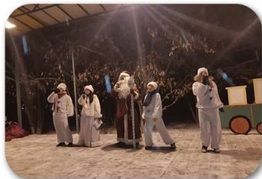
(Рис. 6 - Музыкальный экспресс со снеговиками)