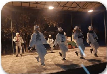
(Рис. 5 - Музыкальный экспресс со снеговиками)