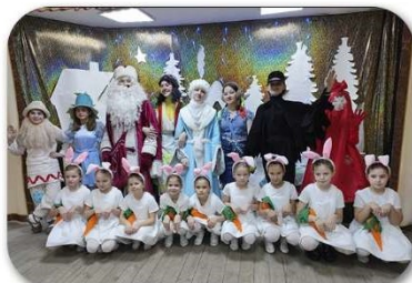
(Рис. 7 - Приключения Новогоднего мешка)