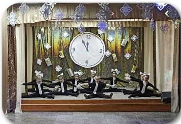
(Рис. 1 - Волшебные часы)