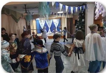
(Рис. 3 - Здравствуй Дедушка Мороз)