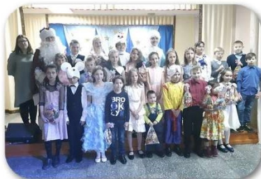
(Рис. 4 - Здравствуй Дедушка Мороз)