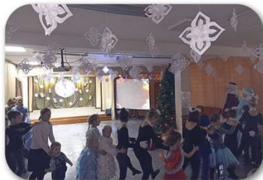
(Рис. 2 - Волшебные часы)