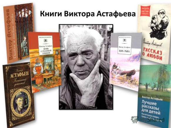
Книги Виктора Астафьева