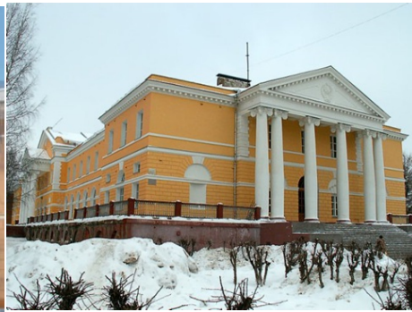
Дворец культуры фабрики им. Ногина