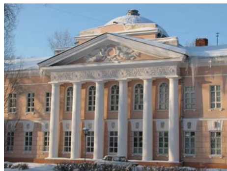
Вичугская центральная районная больница