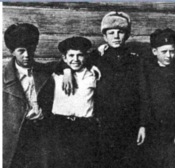
Ю́ра с то́варищами