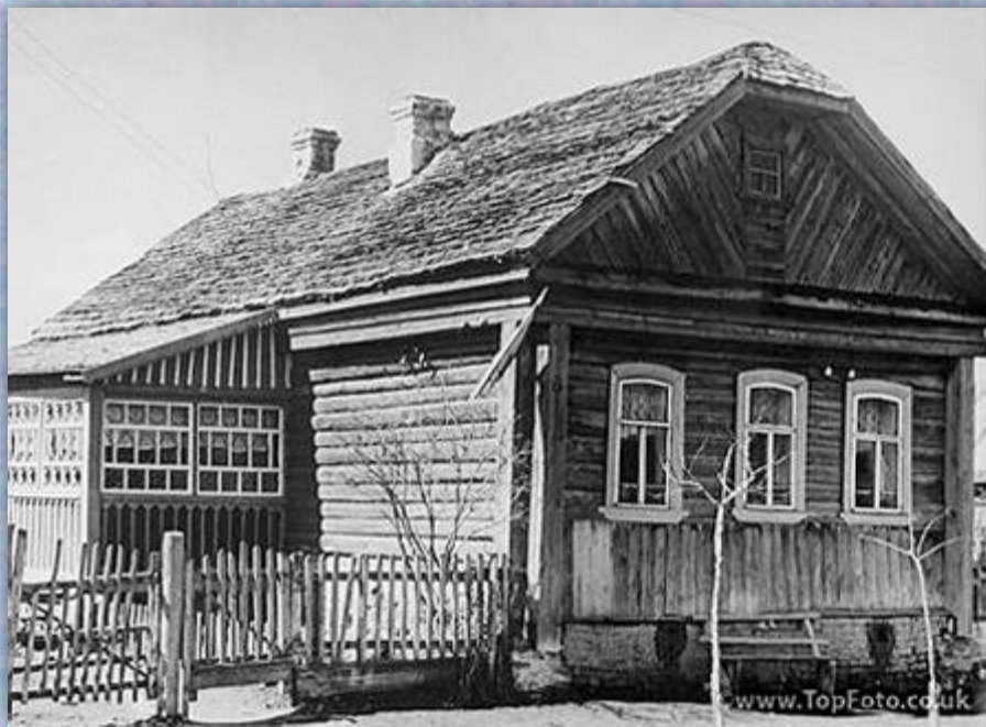
Дом семьи́ Гага́риных

У него́ было́ тяжёло́е де́тство́, по́тому́ что́ шла война́.