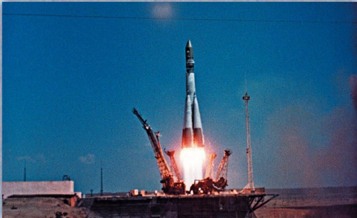
Старт раке́ты «Вōстóк»

Ю́рий Гага́рин стал пёрвым кōсмōна́втōм, ōблетéвшим нáшу планéту. Он прōвёл в кōсмōсе 108 (сто вóсемь) минúт.