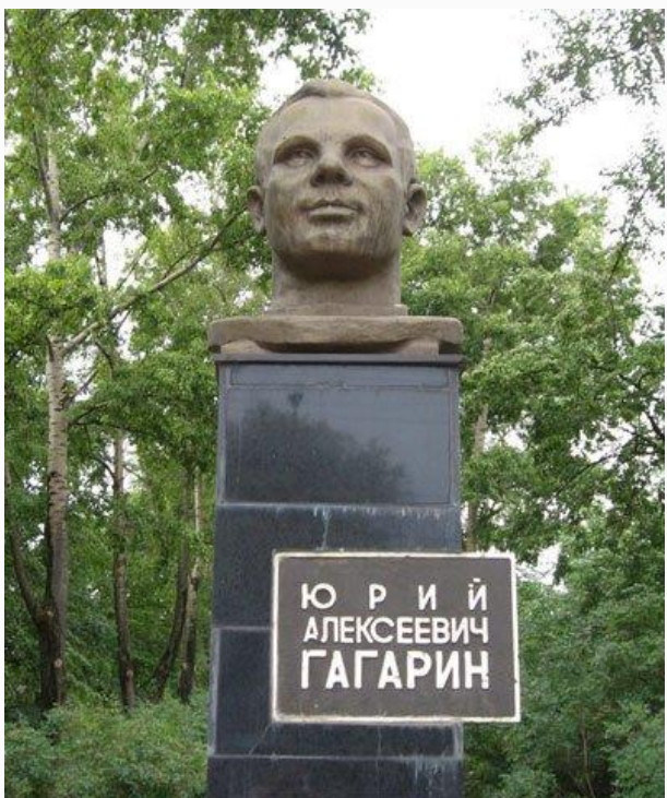
Памятник Ю. Гагарину в Москве