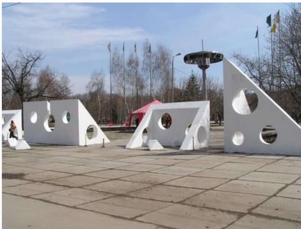
Парк им. Ю. Гагарина в Самаре

Во многих городах России и в городах других стран существуют улицы названные именем космонавта, проспекты, площади, бульвары, парки, клубы и школы имени Гагарина.