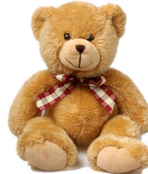
Ишка-ишка-ишка – плюшевый мишка