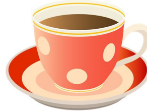
Ашка-ашка-ашка – чайная чашка