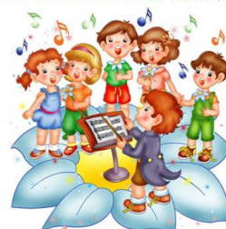
Шо-шо-шо – дети поют хорошо