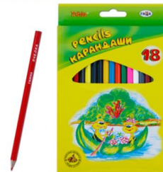
Ши-ши-ши – новые карандаши