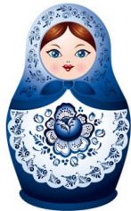
Ошка-ошка-ошка – деревянная матрёшка