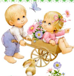
Ши-ши-ши – это наши малыши