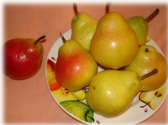
Ши-ши-ши – на тарелке груши