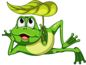
Ушка-ушка-ушка – зелёная лягушка

Щу-щу-щу - я капусту поищу. Ощ-ощ-ощ - не клади в кастрюлю хвощ! Щу-щу-щу - я морковку поищу. Ща-ща-ща - брат принес домой леща. Щи-щи-щи - поедим сначала щи.