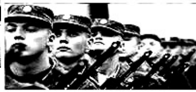
1 ГОД ВОЕННОЙ СЛУЖБЫ ПО ПРИЗЫВУ