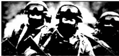
2 ГОДА ВОЕННОЙ СЛУЖБЫ ПО КОНТРАКТУ

НА ОСНОВАНИИ ФЕДЕРАЛЬНОГО ЗАКОНА № 91 ОТ 1 МАЯ 2017 Г. У ГРАЖДАН ИМЕЮЩИХ СРЕДНЕЕ ПРОФЕССИОНАЛЬНОЕ ОБРАЗОВАНИЕ ЕСТЬ ВОЗМОЖНОСТЬ ПОСТУПЛЕНИЯ НА ВОЕННУЮ СЛУЖБУ ПО КОНТРАКТУ НЕ ПРОХОДЯ ВОЕННУЮ СЛУЖБУ ПО ПРИЗЫВУ.