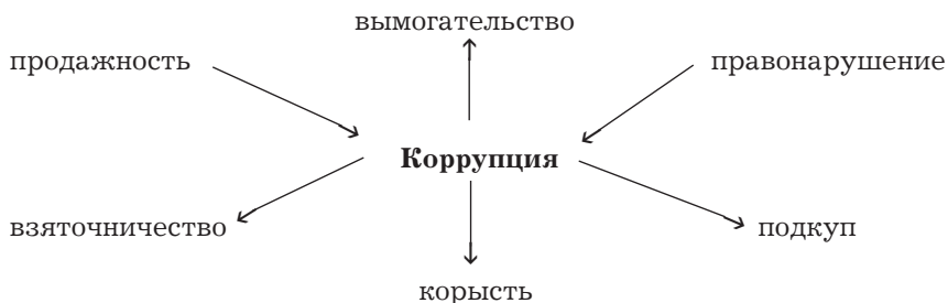
Схема - кластер

Учитель предлагает ознакомиться с некоторыми определениями понятия «коррупция» (от лат. corruptio — подкуп, порча, упадок), которые приводятся в различных справочных изданиях и документах.