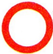
Движение всех транспортных средств запрещено