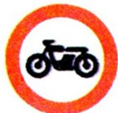
Движение на мотоциклах запрещено