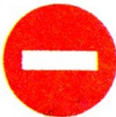
Въезд всех транспортных средств запрещен