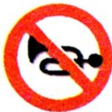
Подача звукового сигнала запрещена