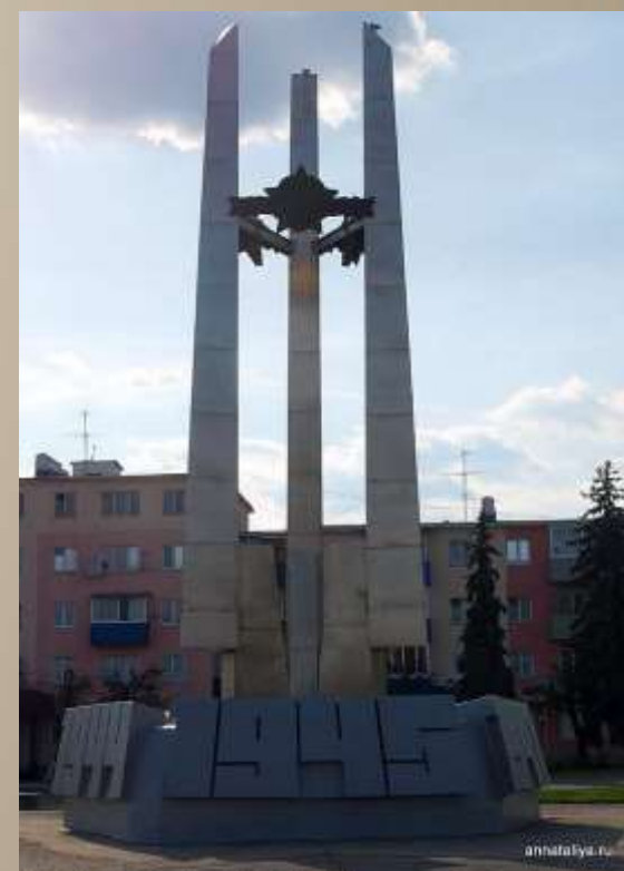
Памятник защитникам Ельца