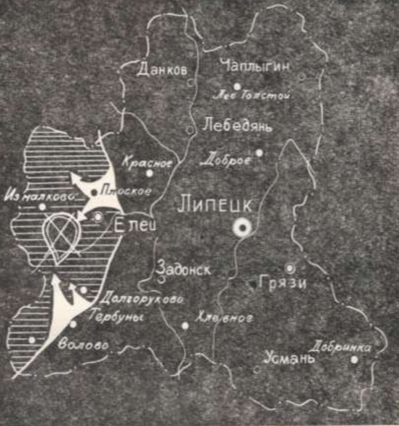
Бои с немецко-фашистскими войсками на территории нынешней Липецкой области (декабрь 1941 г.)

В результате Елецкой операции немцы потеряли убитыми и ранеными 12000 солдат и офицеров, были разгромлены четыре немецкие дивизии. Советские войска захватили богатые трофеи: 226 орудий, 319 пулеметов, 164 автомата, 1286 винтовок, 907 автомашин. От врага была освобождена территория в 8 тысяч квадратных километров с 400 населенными пунктами и 3 городами.