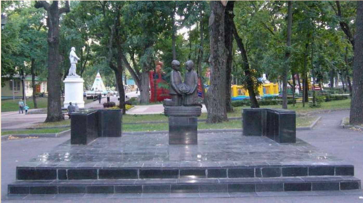
Памятник детям, погибшим в Великой Отечественной войне в Верхнем парке Липецка