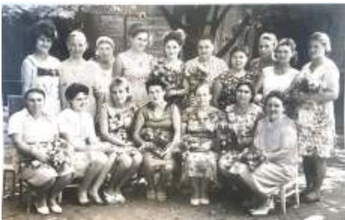
(1 сентября 1965 г.)