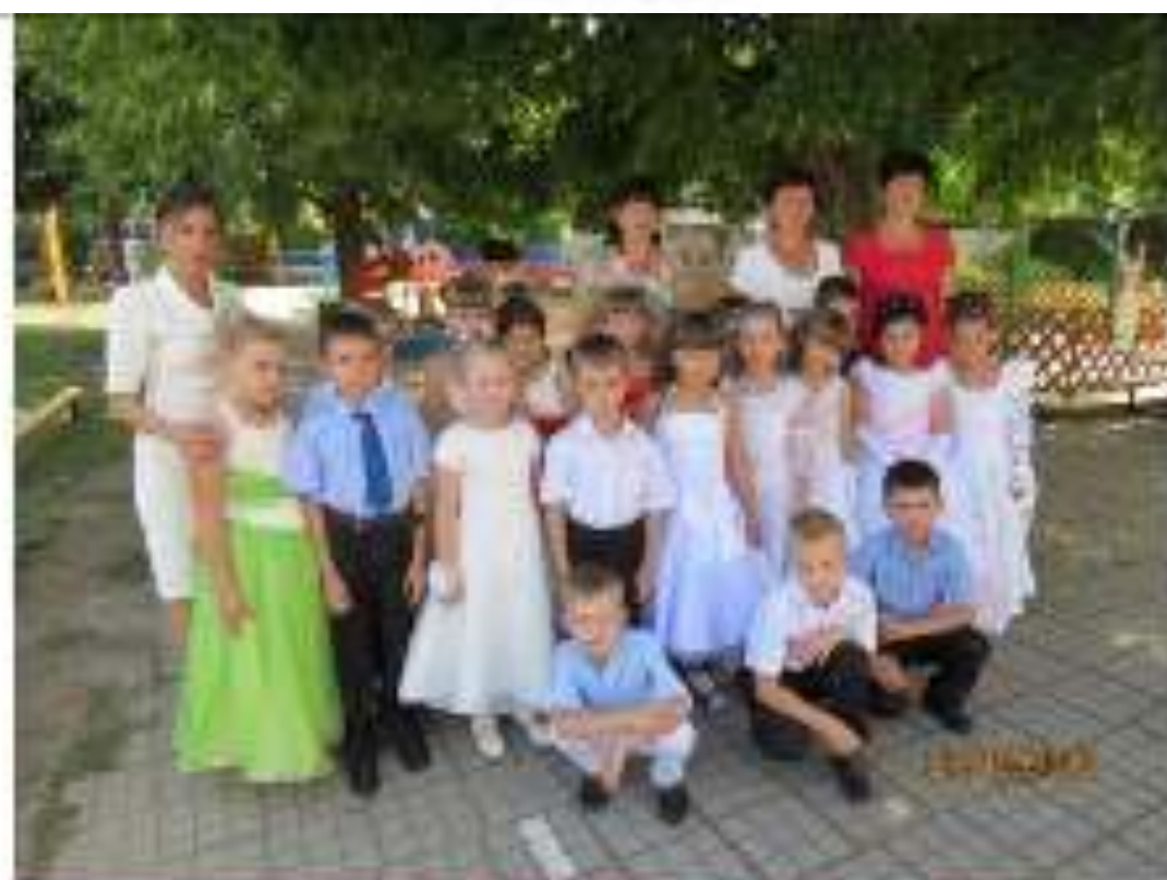
ДОУ ПИТАЙНИК И (детский сад «Будущее староня») - ИЮНЬ 2013 год