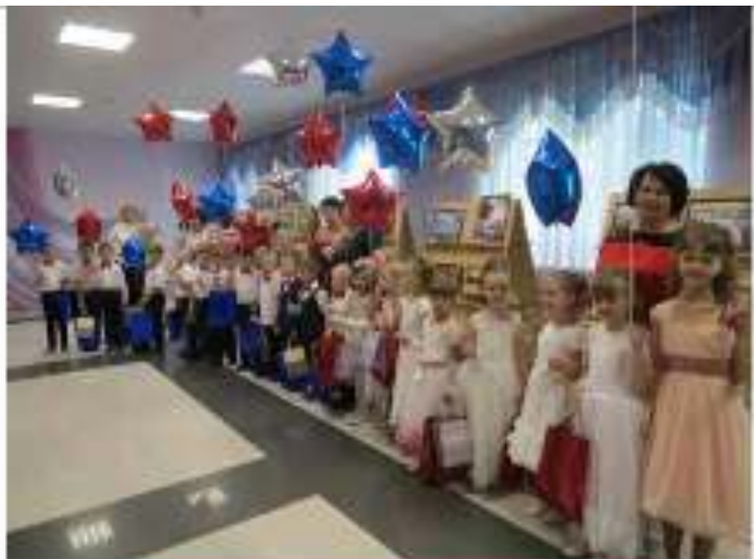
Встречающая церемония «Красная шапочка» - 2018 г.г.