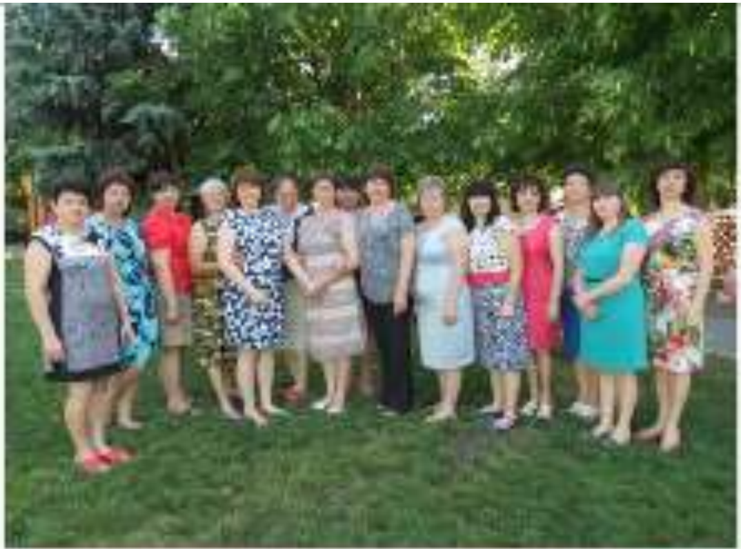
Коллектив артистов сцены «Юности» поздравляет наших воспитанников в саду - 2015 год