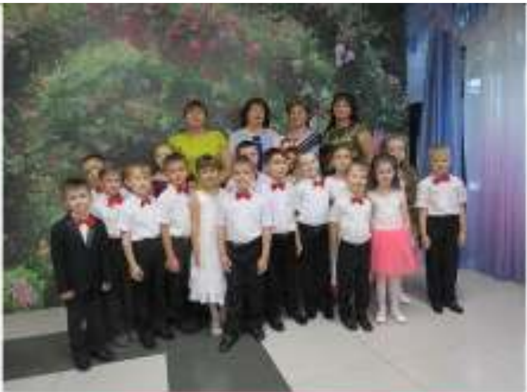
Встречающая церемония «Красная шапочка» - 2016 г.г.