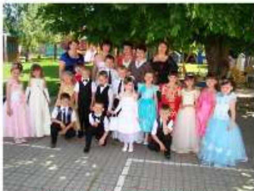
ДОУ ПИТАЙНИК И (детский сад «Будущее староня») - ИЮНЬ 2013 год