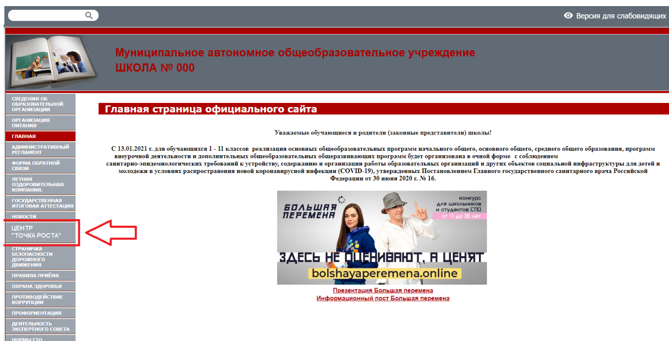
Рисунок 2. Пример размещения ссылки на раздел на сайте общеобразовательной организации

На официальном сайте общеобразовательной организации, в которой создается центр образования естественно-научной и технологической направленностей «Точка роста» (далее – центр «Точка роста», центр) в рамках федерального проекта «Современная школа» национального проекта «Образование», не позднее даты начала функционирования центра (не позднее 1 сентября года создания центра) создается раздел «Центр «Точка роста». Ссылка на раздел размещается в главном меню сайта общеобразовательной организации и должна быть видима при просмотре каждой страницы. Ссылка не может являться вложенной в другие меню. Пример размещения ссылки на раздел «Центр «Точка роста» в меню официального сайта общеобразовательной организации в информационно-телекоммуникационной сети «Интернет» приведен на рисунке 2.