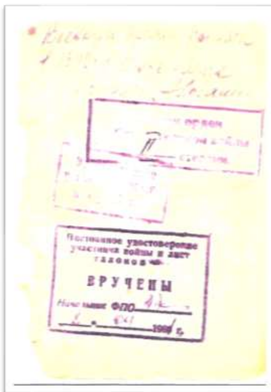
Рисунок 5- страница из красноармейской книжки А.Г. Логашиной