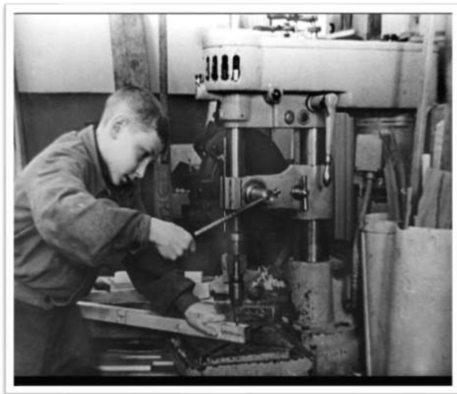
Рисунок 1 - Первые выпускники школ ФЗО