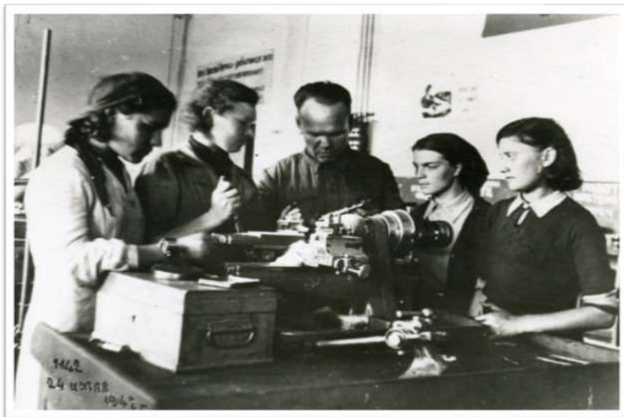
Рисунок 2 - Выпускники школ ФЗО осваивают новые профессии