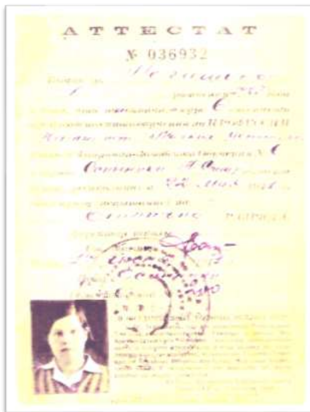
Рисунок 3 – Аттестат об окончании школы ФЗО Логашинной А.Г.