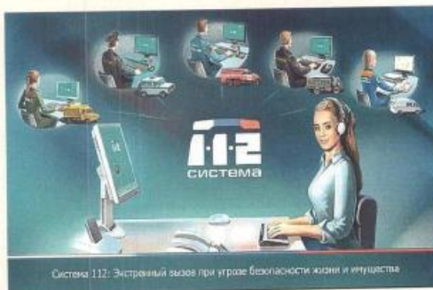
Система 112. Экстренный вызов при угрозе безопасности жизни и имущества

Вы должны ответить на все вопросы, главное будьте спокойны.