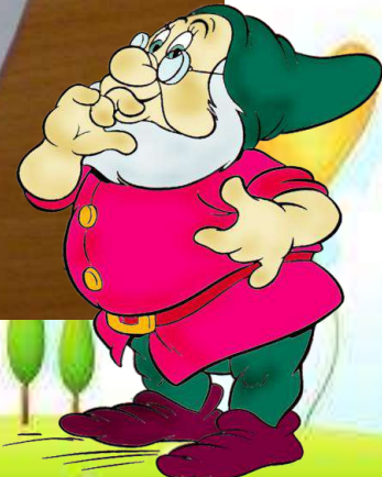
Перспективное планирование по проекту «Страна Лилипутов»