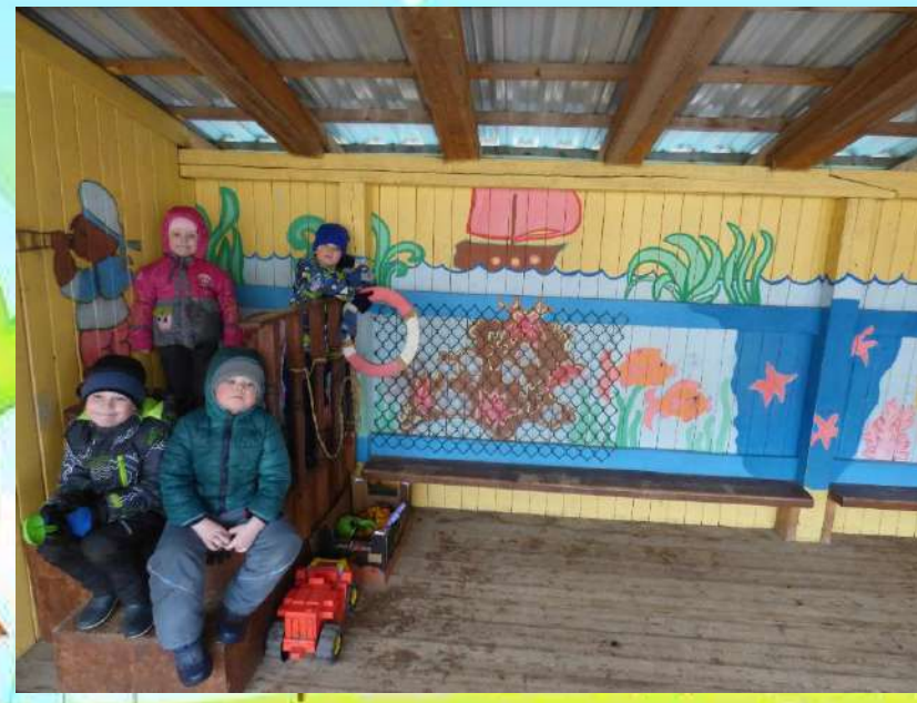
Веранды «Веровочный парк», «Театр», «Морской порт»