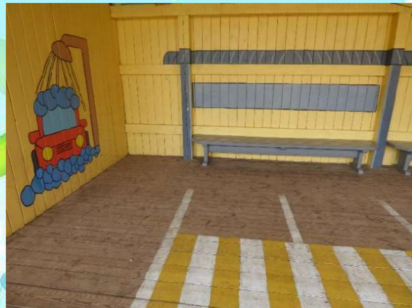
Веранда по ПДД