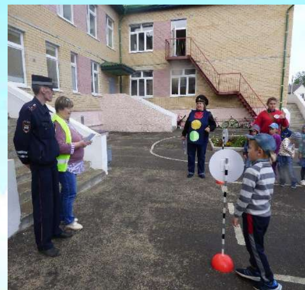
«Безопасное колесико» с приглашением сотрудников ГИБДД